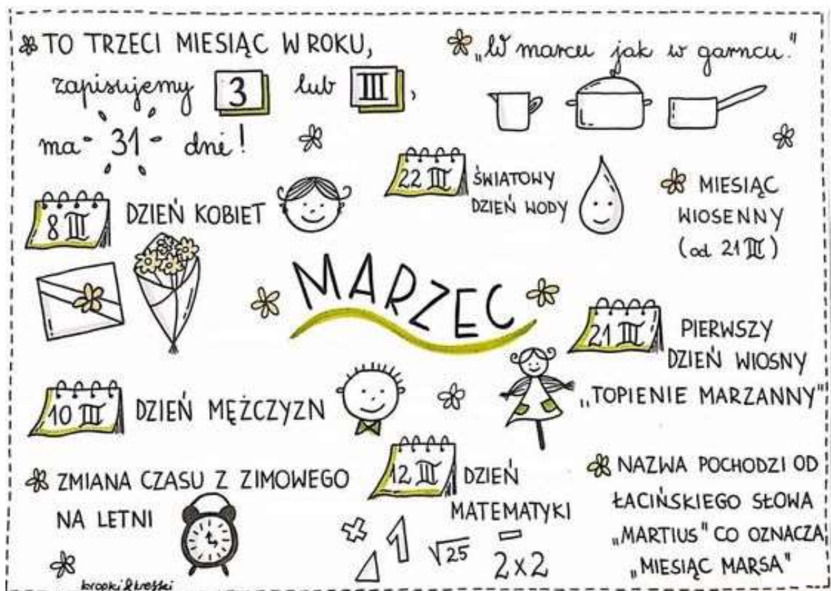
Rysunek: Sylwia Oszczyk