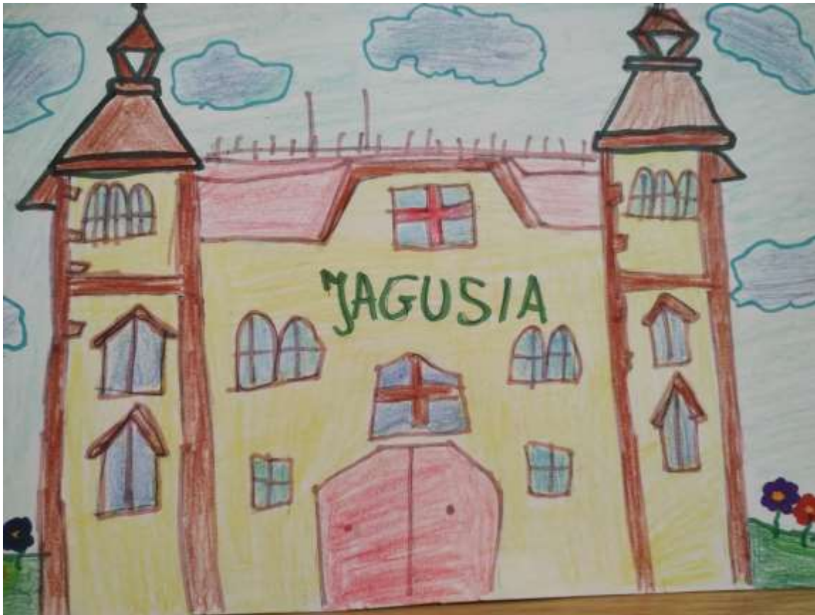
Rysunek: Laura, klasa7