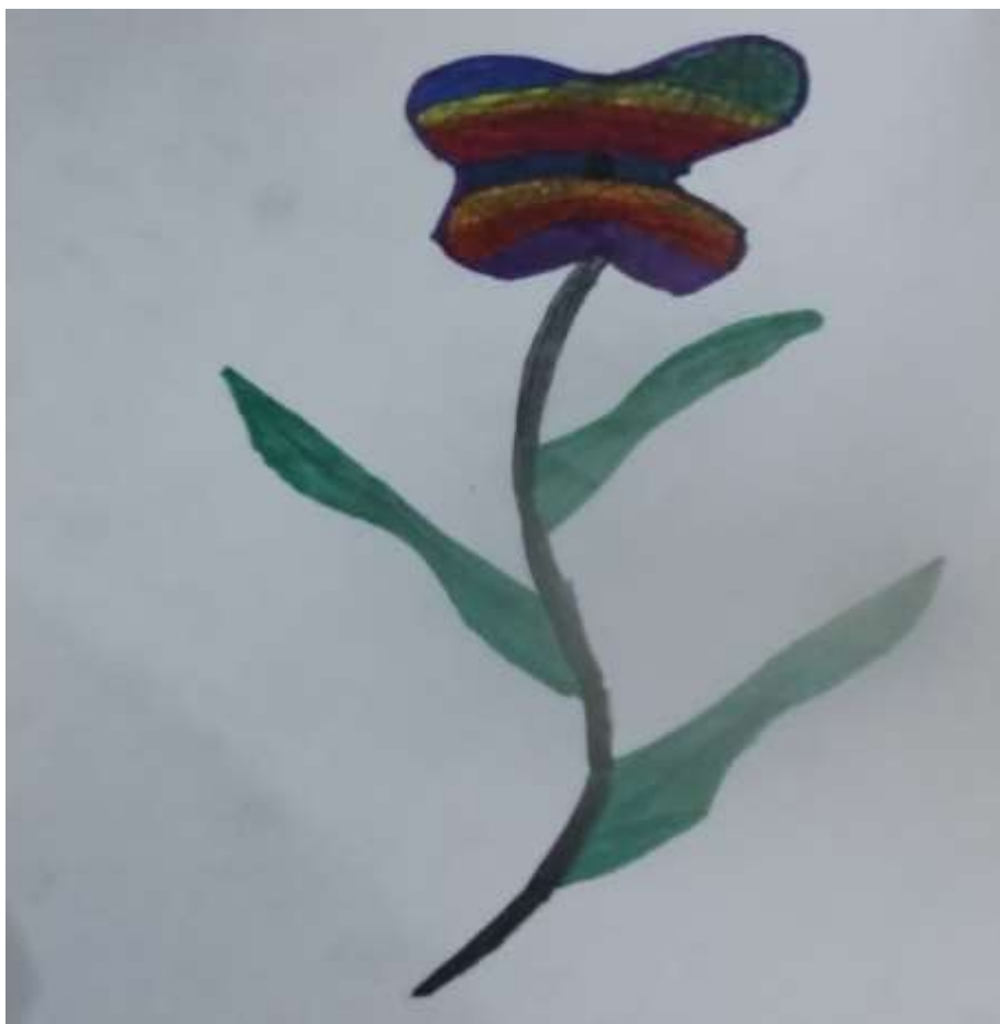
Rysunek: Brajan, klasa7